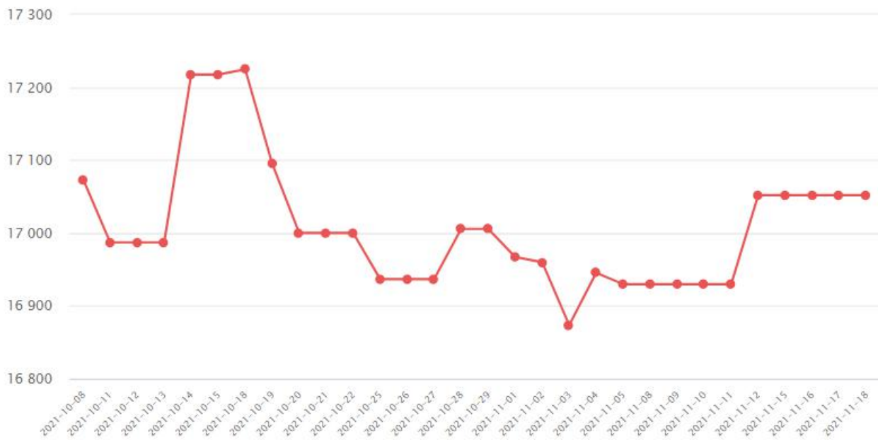
iShares 白银 ETF 白银持有量(吨)